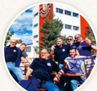
Größter FANCLUB Italiens Kelleriani Scalligeri Aps

Die Brauereifeste waren immer schön, erinnert sich die 72-Jährige. „Das Bier schmeckt mir immer noch wunderbar, zum Glück bekomme ich es inzwischen auch in Mainz – nur das Dunkle gibt es nicht, das bedauere ich schon.“ Ein Highlight ist immer die FAN-Post. „Auf das T-Shirt, das ich übrigens stolz trage und damit Werbung mache, freue ich mich immer ganz besonders.“