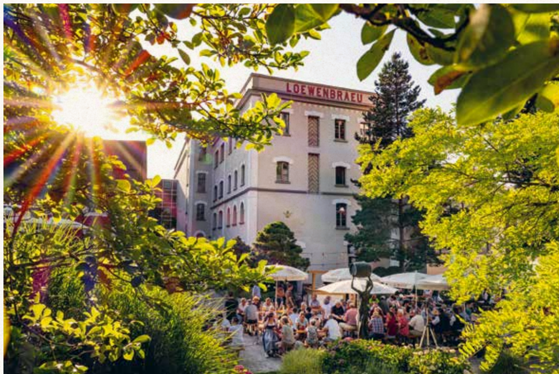
Der Festivalsommer kann kommen – in Meckatz hat er mit dem Brauereifest schon begonnen.