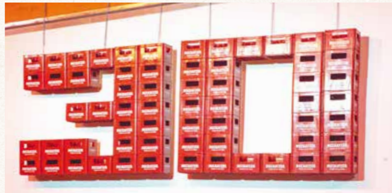
In der Meckatzer Lounge wurde beim Brauereifest stilsiecht gefeiert – mit einer riesigen „30“ aus Meckatzer-Bierkisten.

Sie ist ganz neu im FANCLUB und liebt das Weizen. „Was ihr für die Community hier macht, ist der Wahnsinn“, sagt sie beim Brauereifest, das sie mit ihrem Mann besucht. „Wir kommen hier mit allen ins Gespräch, man setzt sich einfach dazu. Toll.“