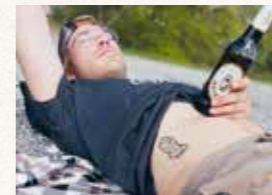
Wahre Fans: Wenn Meckatzer-Liebe unter die Haut geht.